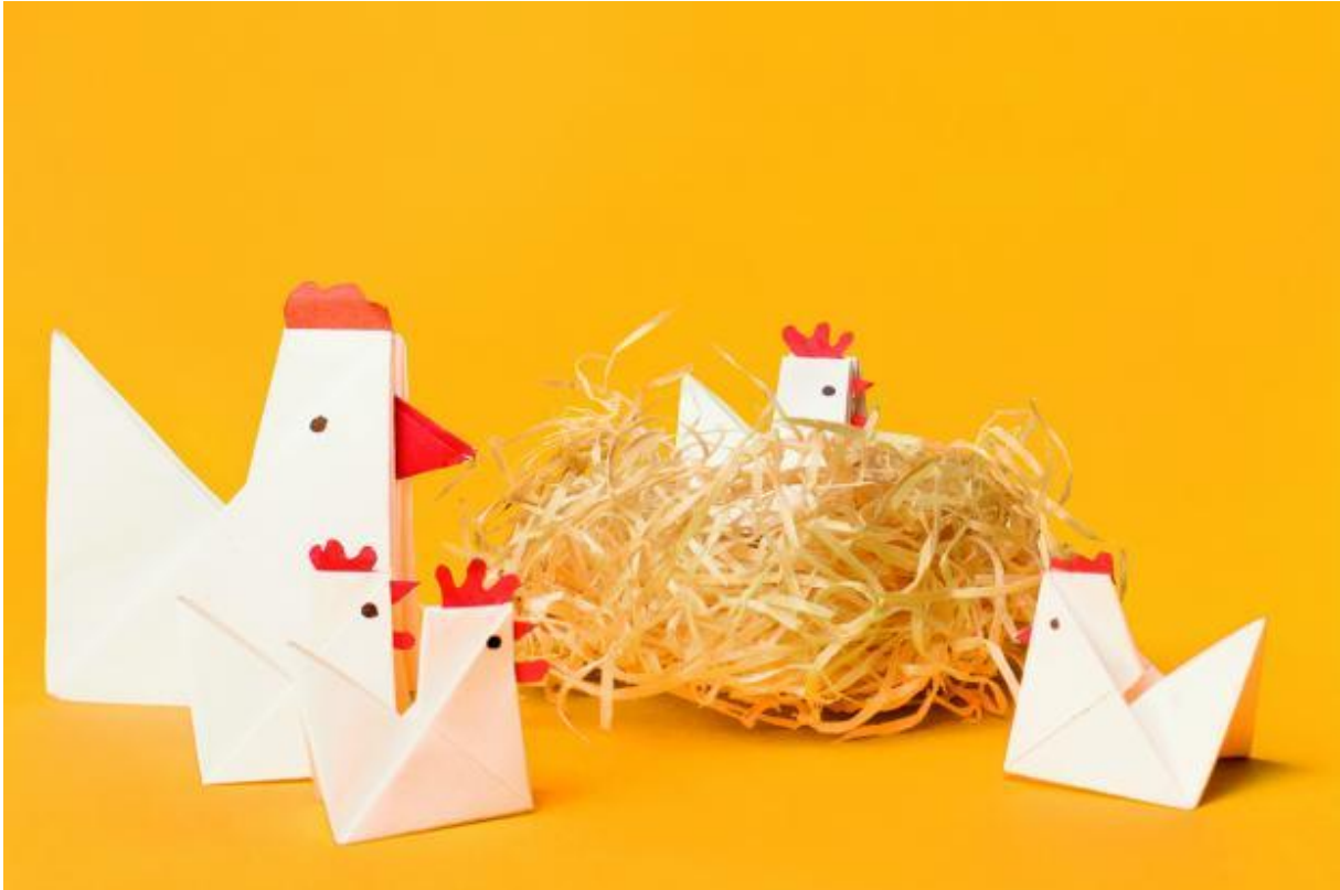
GEOlino Zum Gackern: Papierhühner